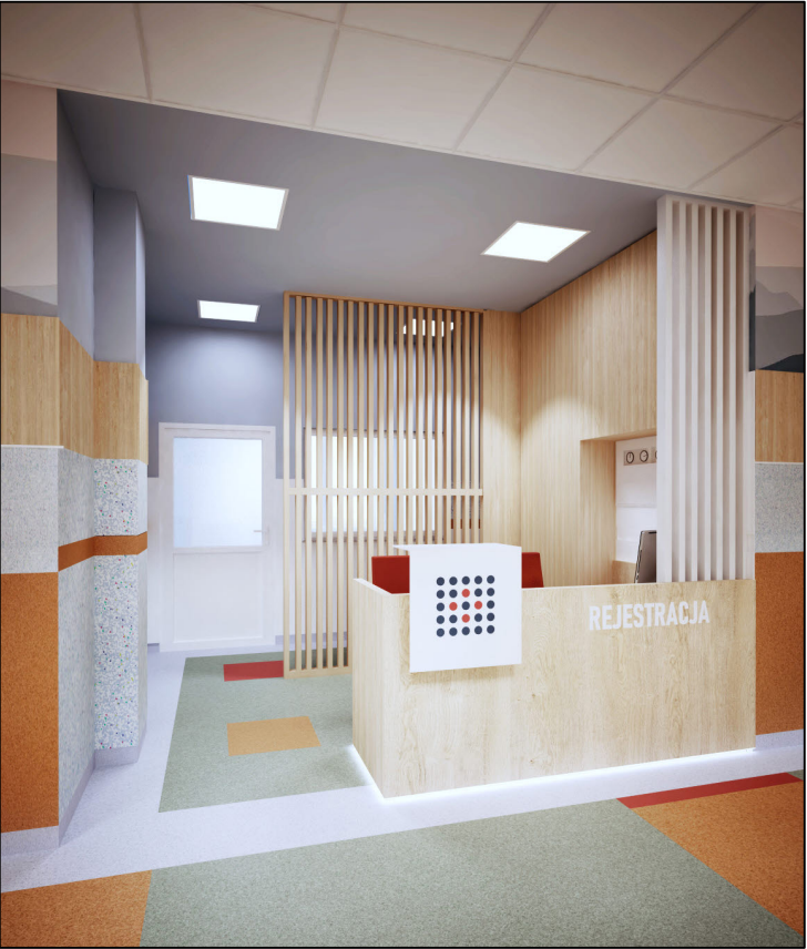
TAPETA PANORAMA GÓR