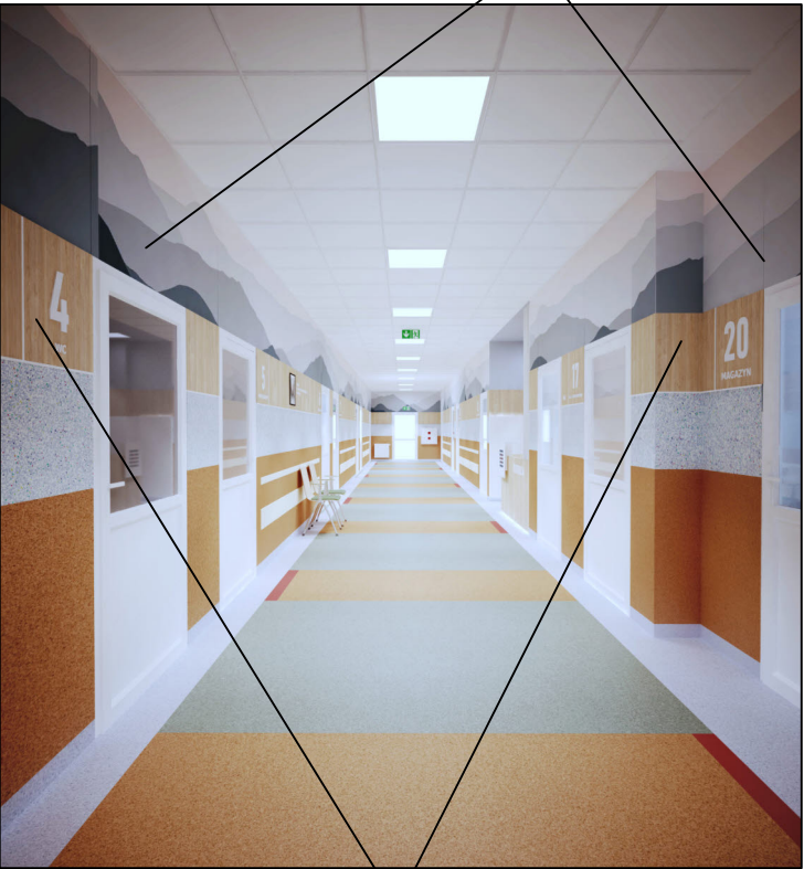
PAS WYKONANY Z OKŁADZINY WINYLOWEJ